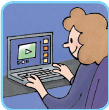
surfer sur Internet