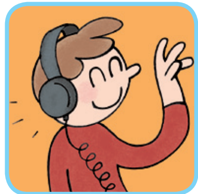
écouter la radio des CD 4