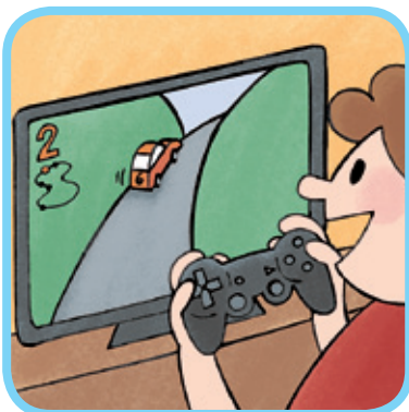
jouer aux jeux vidéo 5