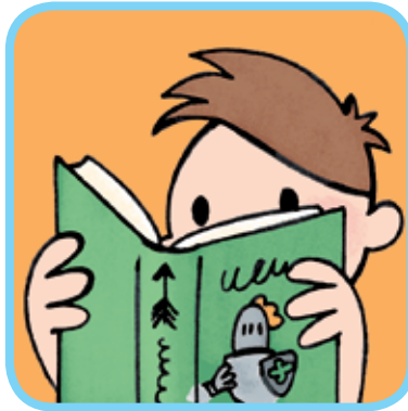
lire des magazines 2 des livres