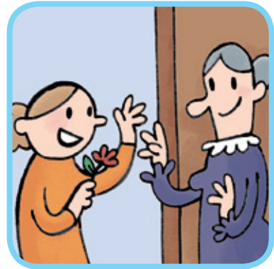
visiter 3 de la famille des copains