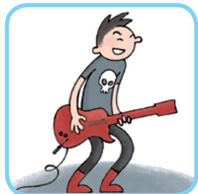
jouer d'un instrument de musique 6