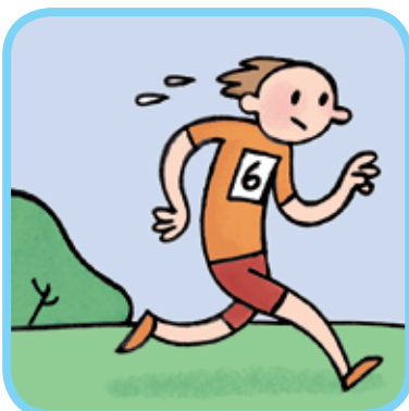
faire du sport