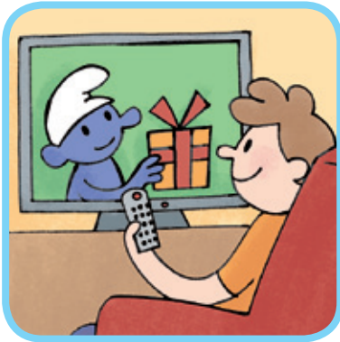
regarder la télé