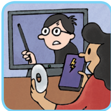
regarder des DVD des vidéos